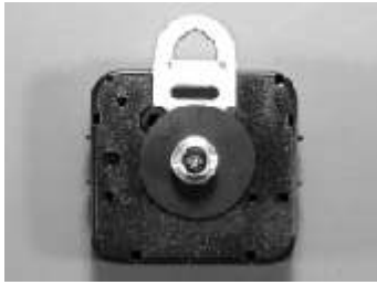
55 100 00 Quarzuhrwerk / Quartz clockwork Länge Uhrenwelle Shaft = 12,5 mm