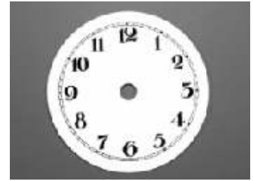
55 160 00 Ziffernblatt "Katzenuhr", weiß Clock face "Cats clock", white D = 10 cm