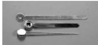
Zeigersatz, lang, Metall, 8,5 cm Hands set, long, metal, 8,5 cm