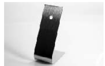
55 120 00 Uhrenständer, NIRO-Metall Clock holder, NIRO-metal 15,5 x 6 cm