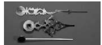
Zeigersatz, verziert, Metall, 9,5 cm Hands set, antique, metal, 9,5 cm