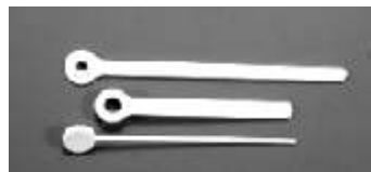
Zeigersatz, Kunststoff, 8,5 cm Hands set, Plastic, 8,5 cm