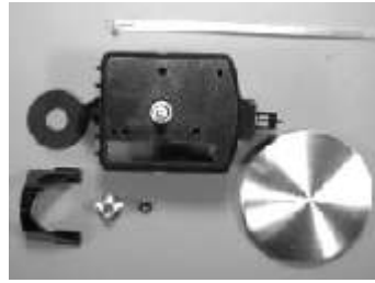
55 110 00 Quarzuhrwerk mit Pendel Quartz clockwork with pendulum