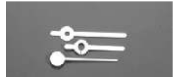
Zeigersatz, kurz, Metall, 5,2 cm Hands set, short, metal, 5,2 cm